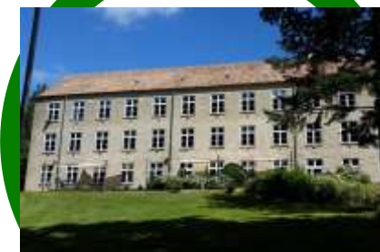
Sødisebakke Bygning C DGNB-Sølv