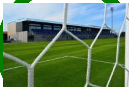
Femhøje Stadion Hjørring Elementer af DGNB