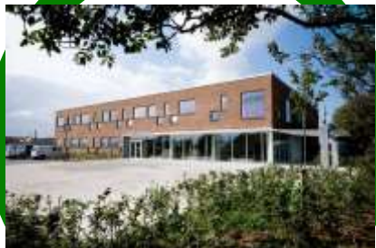
Sundhedshus Pandrup DGNB-Guld