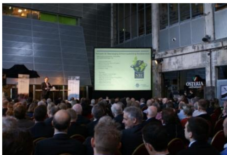
Fra Borgmesterens Morgenbreefing i marts 2012

Morgenbreefingen afholdes tirsdag den 12. marts kl. 7.30-9.30 i Kedelhallen i Nordkraft.