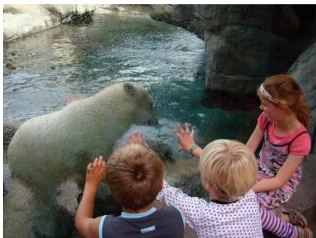
Aalborg Zoo er en af de nordjyske turismevirksomheder, der har valgt at prioritere bæredygtighedsindsatsen.

Forudsætninger for at få midlerne til Aalborg er netværk og samarbejder internationalt, så derfor styrkes denne del på et internationalt niveau.