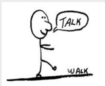
Talk the walk