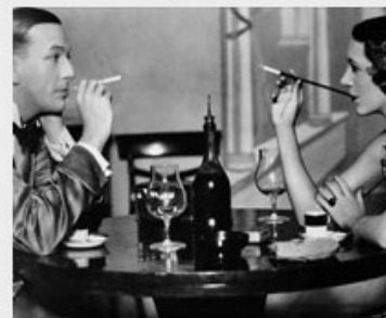
Da farfar var ung