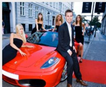
Events der rykker