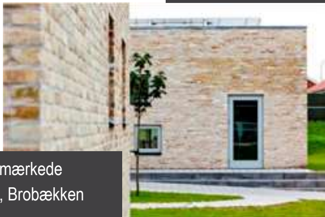
Den svanemærkede børnehave, Brobækken CO2 sparet: 15 ton