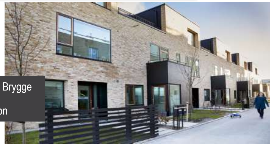
Byhusene, Islands Brygge CO2 sparet: 320 ton