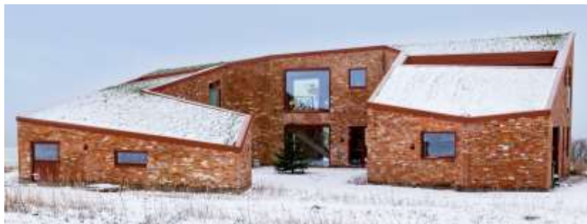
Privat villa. CO2 sparet: 17 t.