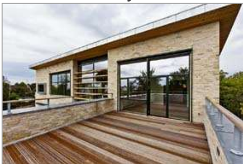
Gamle mursten i ny villa m kalkmørtel