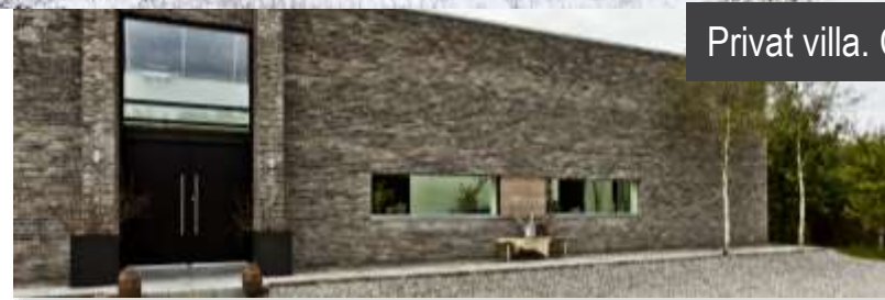
Privat villa. CO2 sparet: 15 t.