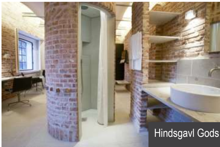
Hindsgavl Gods CO2 sparet: 150 ton