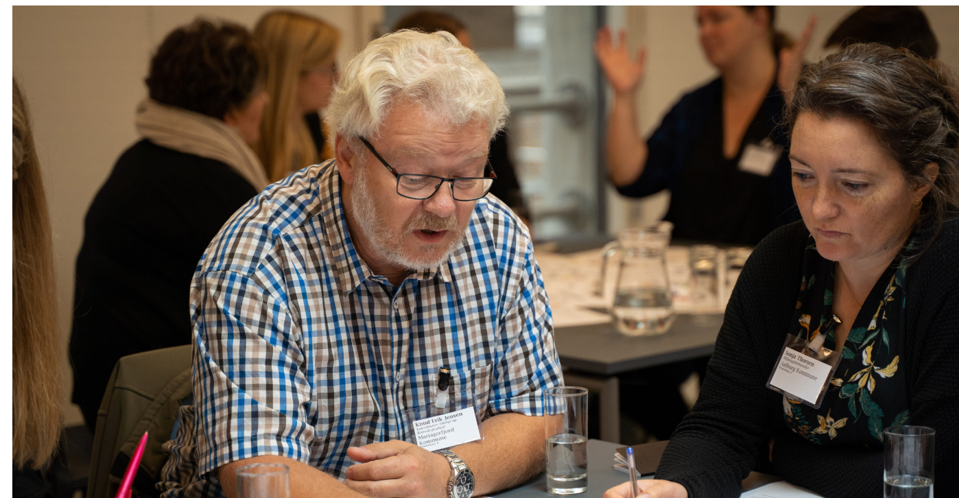
To kommunale miljømedarbejdere under workshop

Visionen for Det Cirkulære Nordjylland er at gøre det nemt og attraktivt for private virksomheder og offentlige institutioner, at deltage i den cirkulære omstilling.