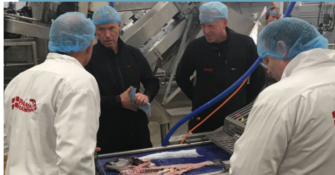
Bæredygtighedsscreening hos Pandalus i Hanstholm

Oversigt over aktiviteter knyttet til Det Cirkulære Nordjylland fordelt på kommuner