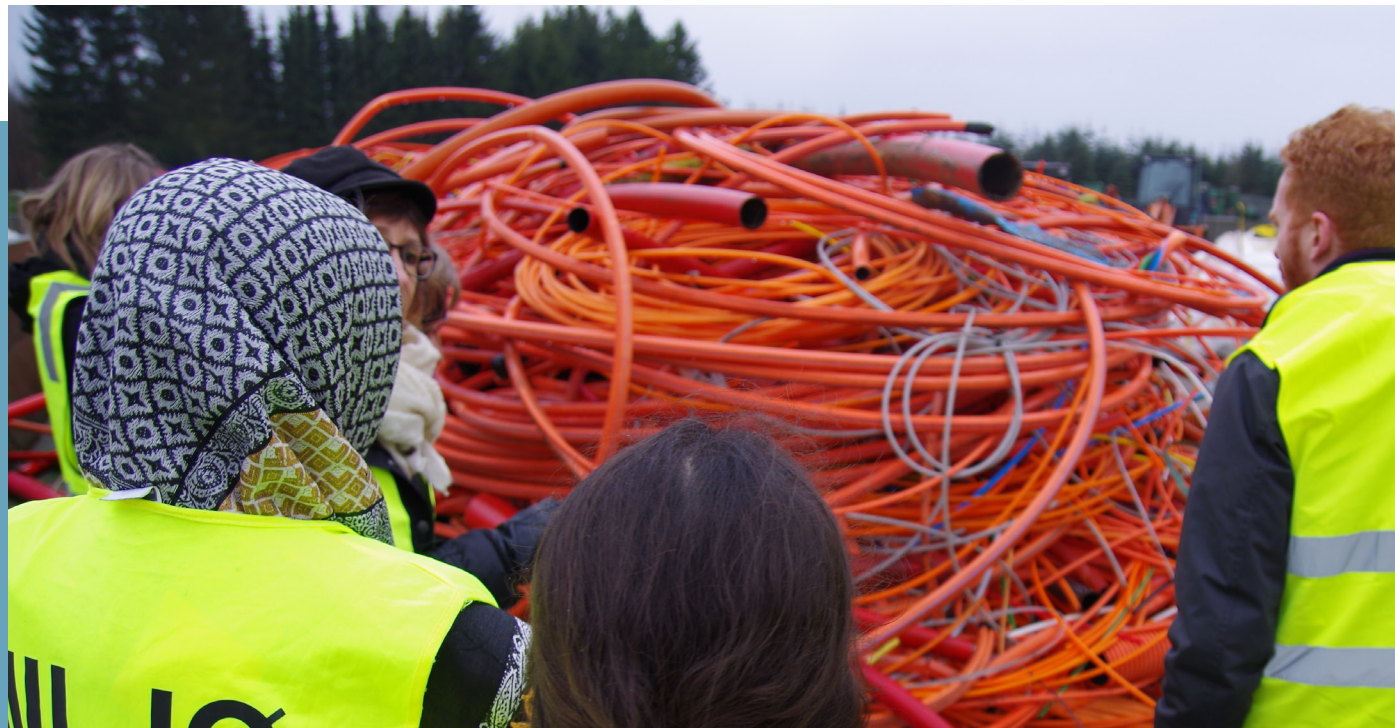
Plastkursus for kommunale miljømedarbejdere

Tovholderne er tilsynsførende fra kommunernes miljøafdelinger, samt erhvervskonsulenter fra erhvervscentrene. Tovholderne er bindeleddet mellem NBE og kommunerne.