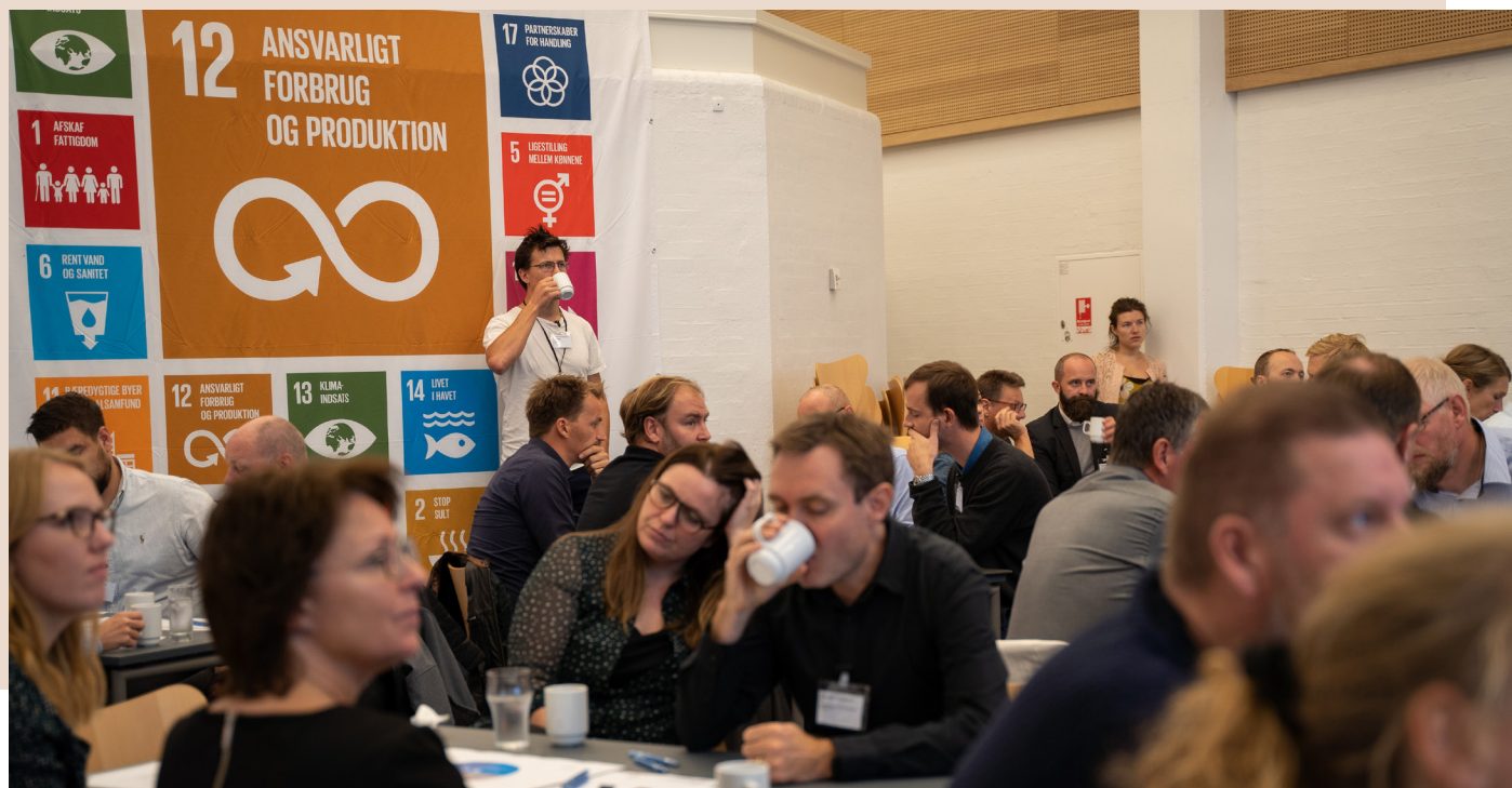
160 nordjyske deltagere til arrangementet "Udvikling via Verdensmålene"