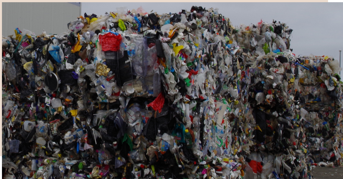
Borgernes affald skal understøtte de nordjyske virksomheders værdikæder

mod genanvendelse og genbrug (cirkulær model). Der arbejdes dels med et set-up på industrielt niveau, således der kan aftages meget store mængder, samt at værdikæderne er åbne og tilgængelige, således, at flest muligt kan deltage i værdikædesamarbejdet. De forskellige værdikædesamarbejder er understøttet af videnspartnere fra AAU, der kvalitetssikrer aktiviteterne, og sørger for at bidrage med den nyeste forskning. Dette kombineret, medfører at materialer kan sendes til genanvendelse/genbrug i et nordjysk cirkulært loop, samtidig med at det nordjyske erhvervsliv opnår en økonomisk gevinst samt en brandinggevinst, som medfører en konkurrencemæssig fordel. Således bevares ressourcen og arbejdskraften i Nordjylland.